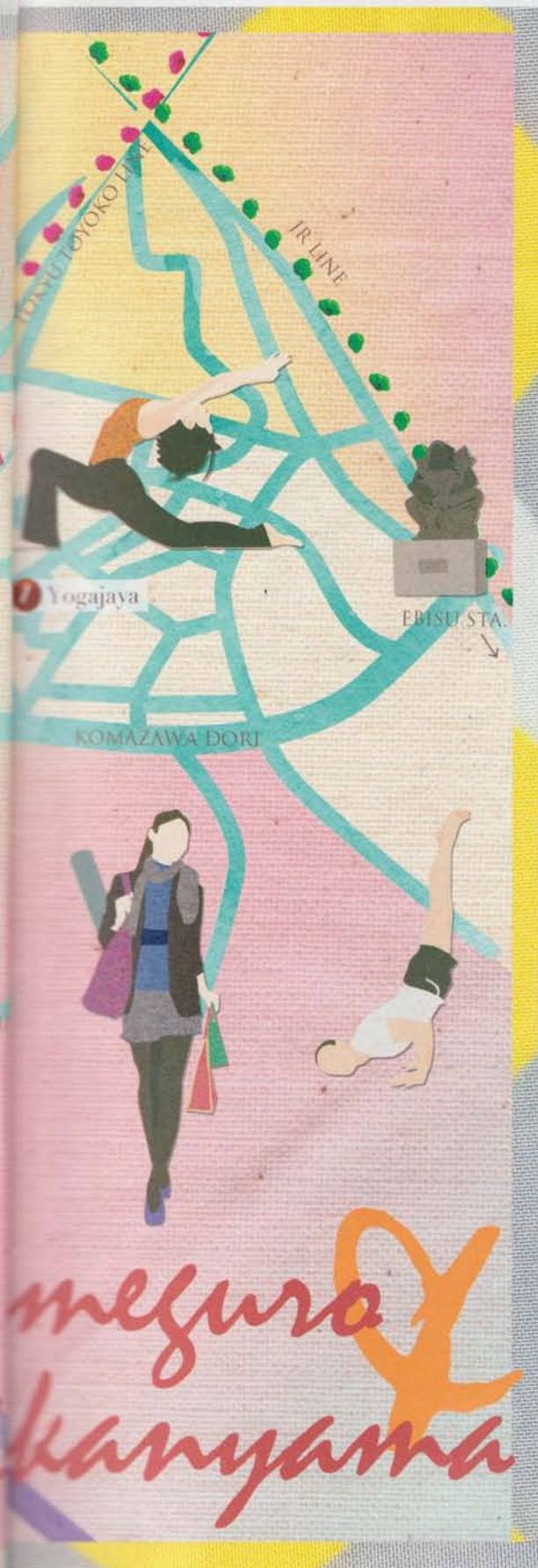
illustration by K+Me

体にやさしい自然派レストランが多い中目黒・代官山エリアに、 ヨガスタジオが急増中。さっそく行ってヨガ散歩を楽しもう!